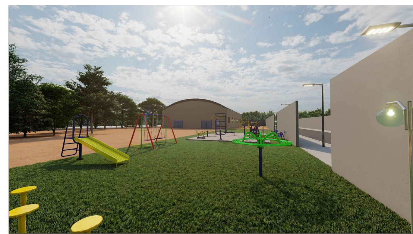
PERSPECTIVA 3D - 04 ESC: SEM ESCALA