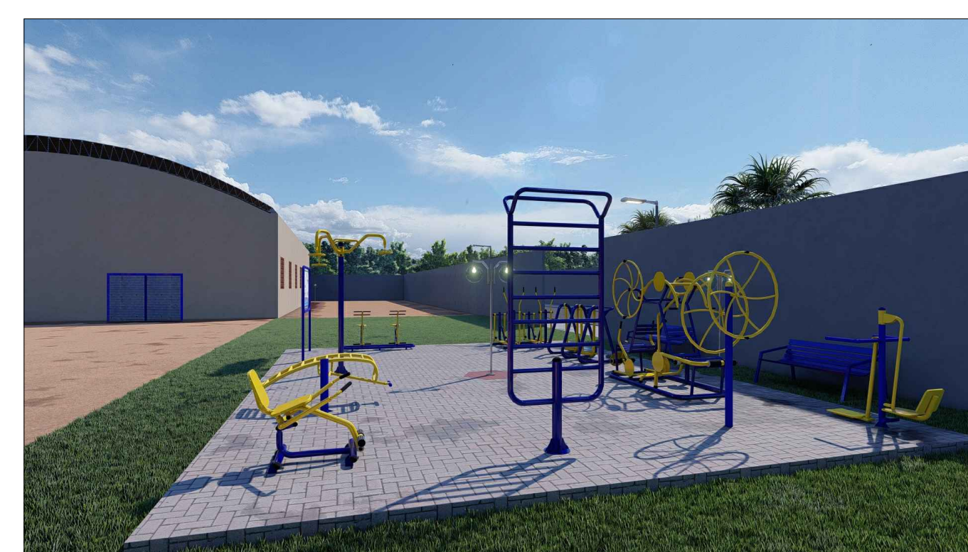
PERSPECTIVA 3D - 08 ESC: SEM ESCALA