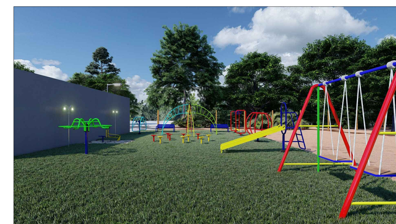
PERSPECTIVA 3D - 07 ESC: SEM ESCALA