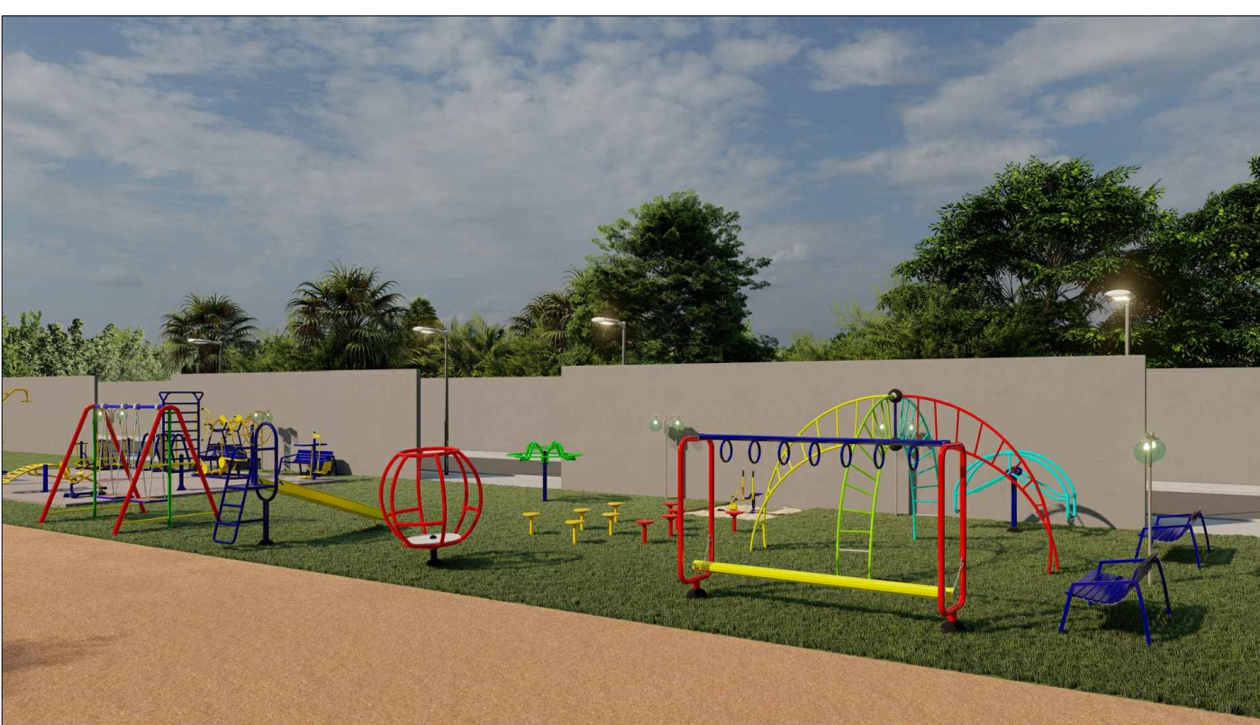
PERSPECTIVA 3D - 03 ESC: SEM ESCALA