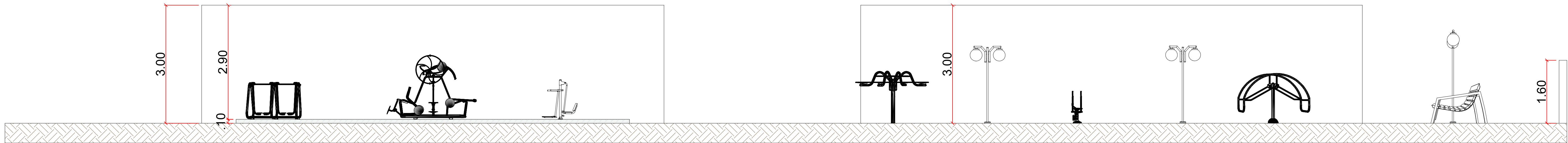
CORTE BB ESC: 1:75