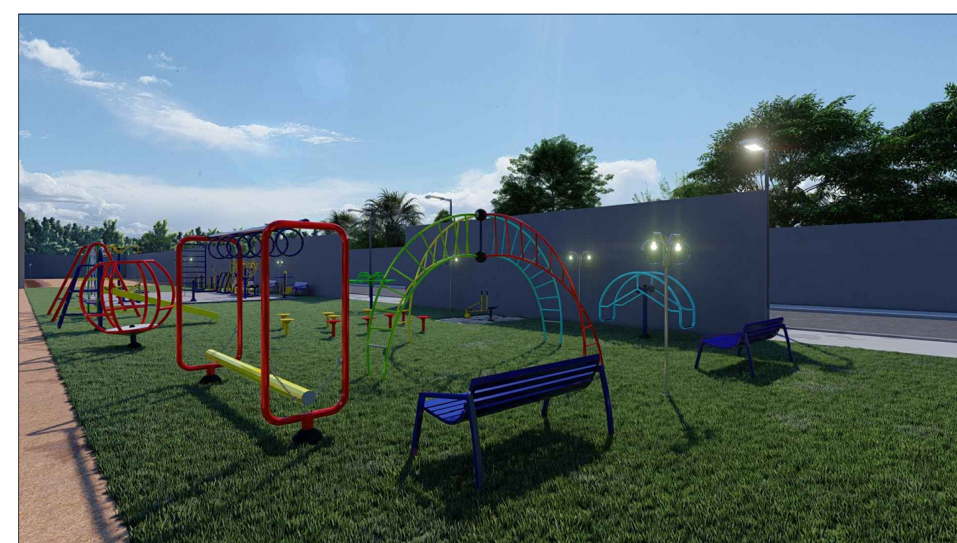
PERSPECTIVA 3D - 01 ESC: SEM ESCALA