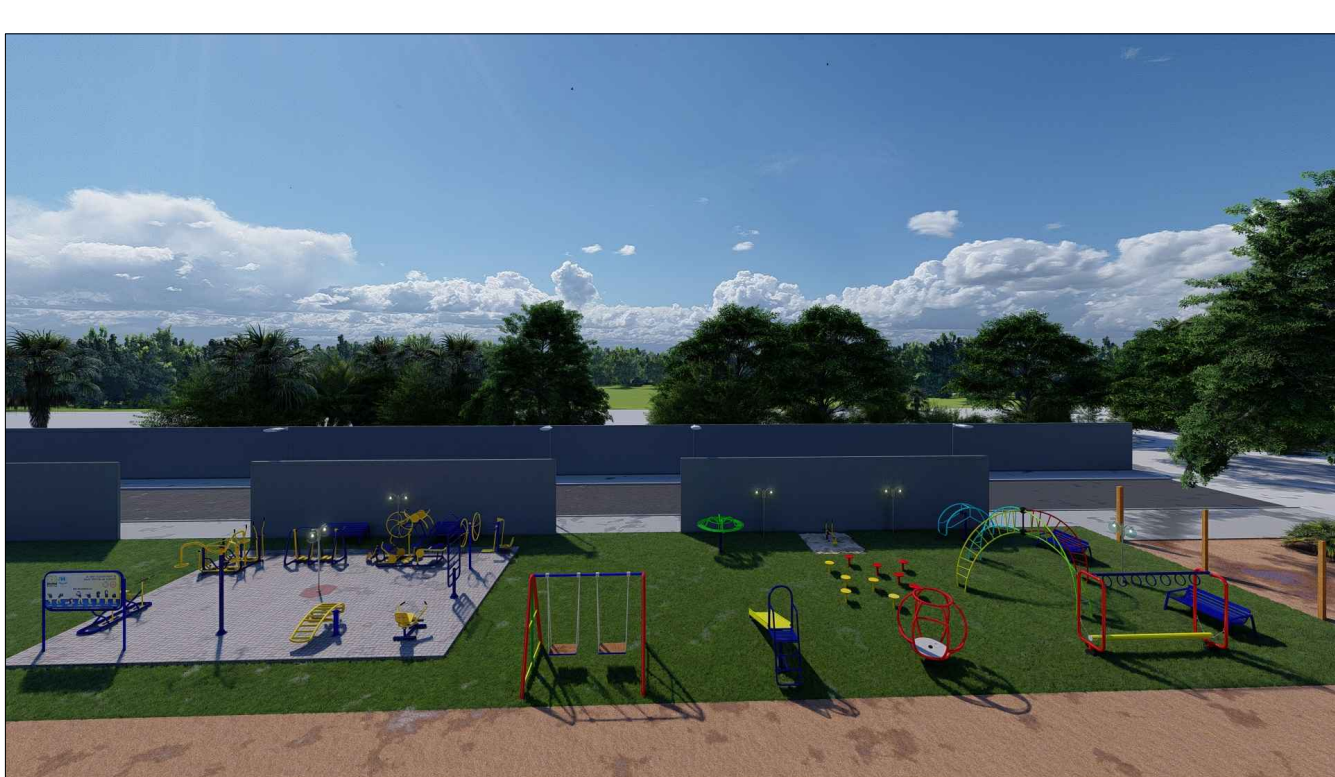
PERSPECTIVA 3D - 09 ESC: SEM ESCALA