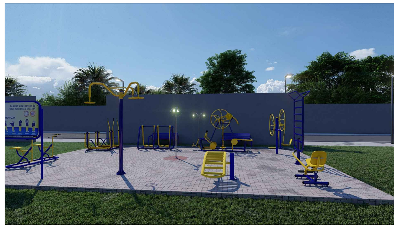
PERSPECTIVA 3D - 05 ESC: SEM ESCALA