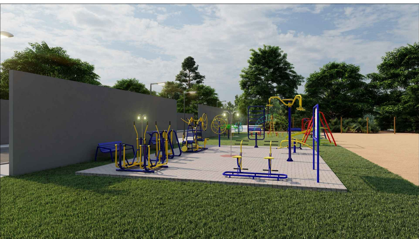
PERSPECTIVA 3D - 02 ESC: SEM ESCALA