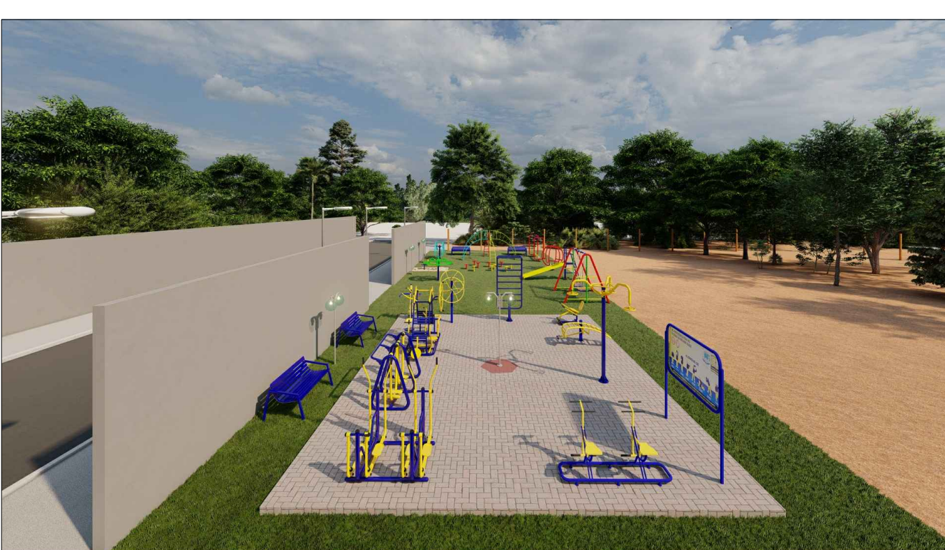
PERSPECTIVA 3D - 06 ESC: SEM ESCALA